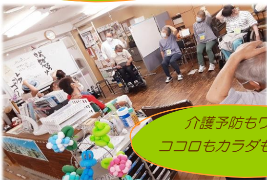
介護予防もワイワイ ココロもカラダもリラックス