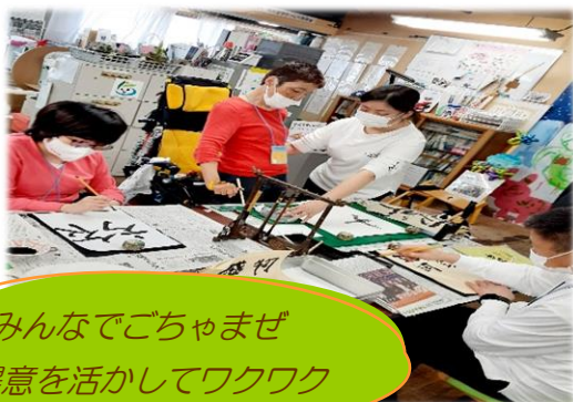
みんなでごちゃませ 得意を活かしてワクワク