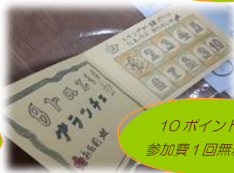
10ポイント獲得で 参加費1回無料特典あり