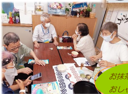
お抹茶でほっこり一息 おしゃべりに花が咲き