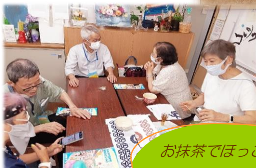
お抹茶でほっこり一息 おしゃべりに花が咲き