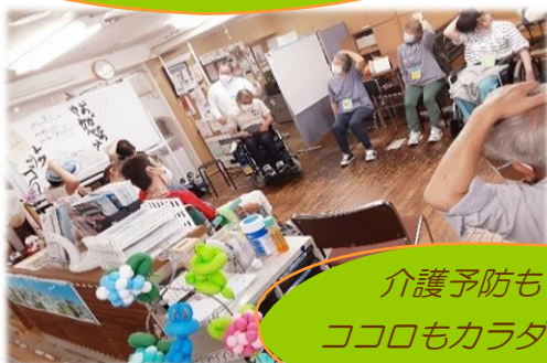
介護予防もワイワイ ココロもカラダもリラックス