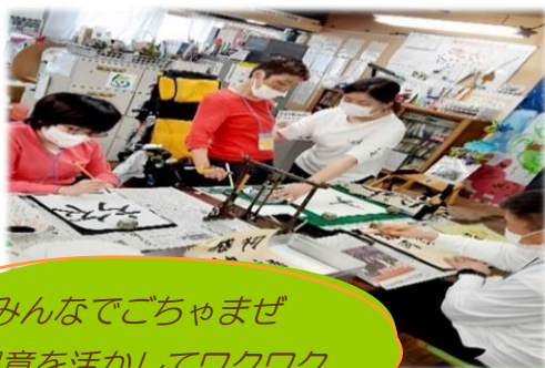
みんなでごちゃませ 得意を活かしてワクワク