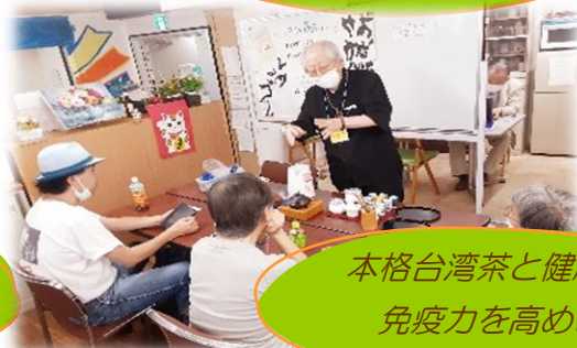
本格台湾茶と健康講話 免疫力を高めます