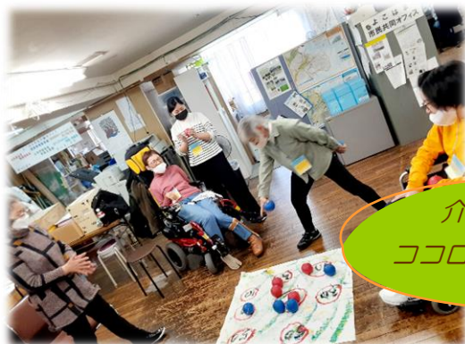
介護予防もワイワイ ココロもカラダもリラックス