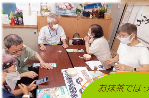
お抹茶でほっこり一息 おしゃべりに花が咲き