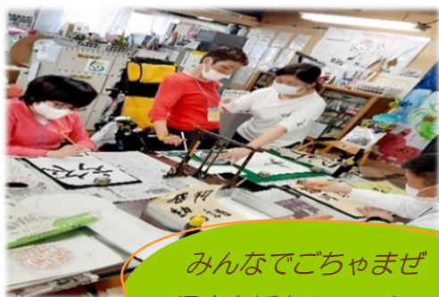
みんなでごちゃませ 得意を活かしてワクワク