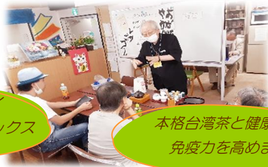
本格台湾茶と健康講話 免疫力を高めます