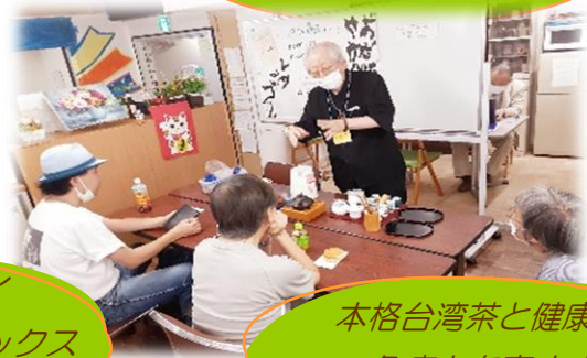
本格台湾茶と健康講話 免疫力を高めます