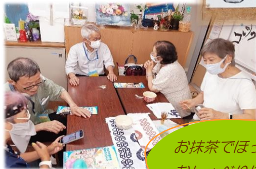
お抹茶でほっこり一息 おしゃべりに花が咲き