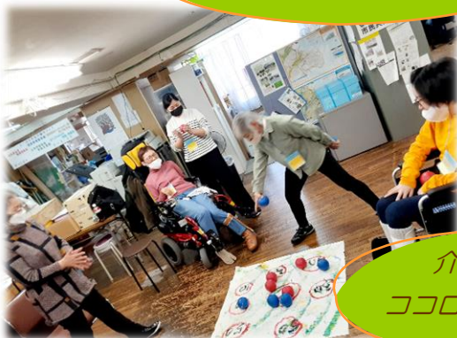
介護予防もワイワイ ココロもカラダもリラックス