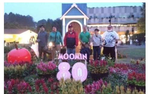
ムーミンバレーパークにて