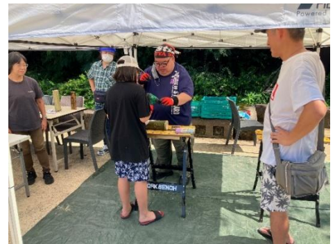
「竹とうろうをつくろう」WS

協議会が運営する就労継続支援 B 型 IKIIKI カンパニーでは、SDGs をテーマに竹や壁紙クロスを使った自主製品作りに取り組んでいます。その中でも特に竹あかりは様々なイベントでの販売や交流の中で注目されることが多いです。障がいを持った人たちの働き方について研究、発信をしている NPO 法人ディーセントワーク・ラボからの依頼で2025年8月に人気スポット埼玉飯能メッツァビレッジまで IKIIKI の竹職人のメンバーさん3名とスタッフ1名で行き、「竹とうろうをつくろう」ワークショップを開催しました。猛暑の中でしたが、多くのこどもさん、中にはお父さん、お母さんが竹にドリルで穴を開けて竹あかりを作る作業に夢中になっていました。遠く埼玉の地で IKIIKI カンパニーの熟年竹職人3名が光り輝きました！その後10月には、同じ飯能メッツァビレッジでのディーセントワーク・ラボ主催「トントウフェス」に事業所として初めて泊りがけで行き、2日間自主製品の販売とバルーンサービスを行いました。お客様が多く、売り上げが上がりました。一人のメンバーさんはイベントスタッフ体験もしました。夜は人気のムーミンバレーパークでの観光も楽しむことができました。メンバーさんたちは「ぜひ来年も行きたいね！」と声を弾ませて話し合っています。